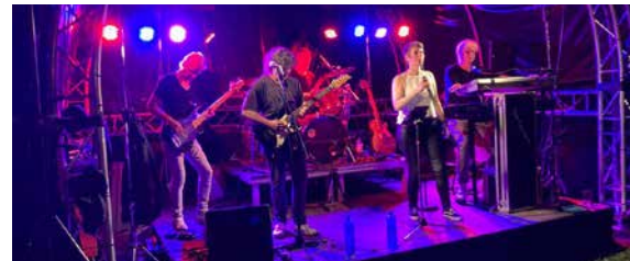
RATHAUS 19:00 - CA. 01:00 UHR THE CANDIES