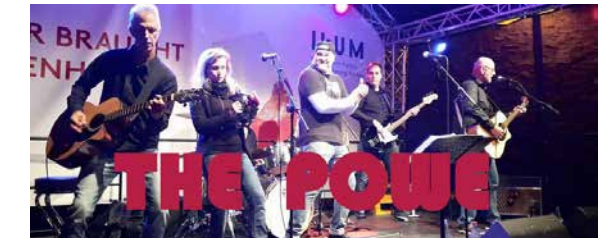
RATHAUS 19:00 - CA. 01:00 UHR THE POWE