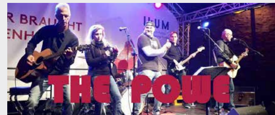
SCHULHOF 19:00 - CA. 01:00 UHR THE POWE