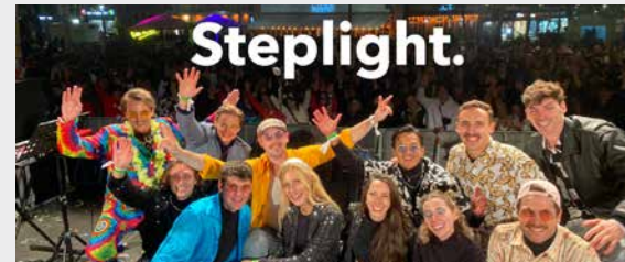
RATHAUS 19:00 - CA. 01:00 UHR STEPLIGHT