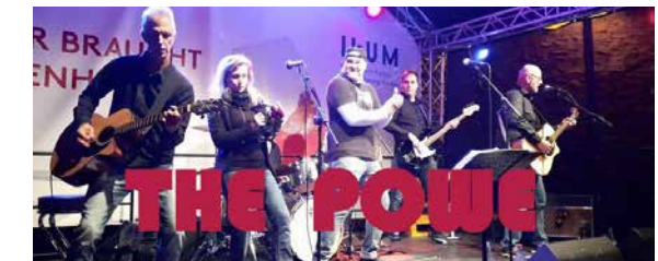
RATHAUS 19:00 - CA. 01:00 UHR THE POWE