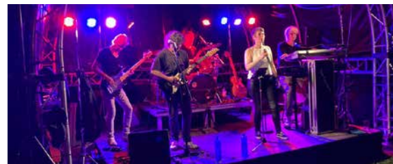
RATHAUS 19:00 - CA. 01:00 UHR THE CANDIES