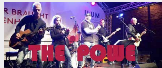
SCHULHOF 19:00 - CA. 01:00 UHR THE POWE