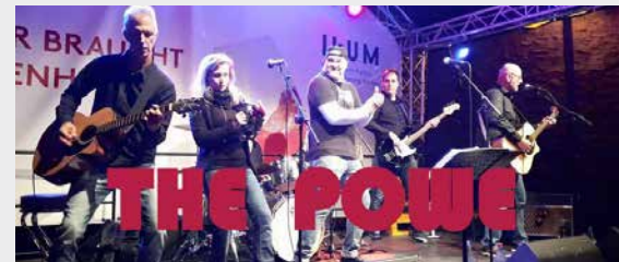
SCHULHOF 19:30 – 24:00 UHR THE POWE