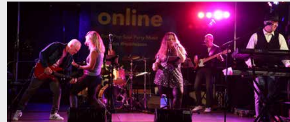
RATHAUS 19:30 – 24:00 UHR ONLINE

18:00 Uhr Öffnung der Weinstände und Höfe 19:30 Uhr Bühnenprogramm