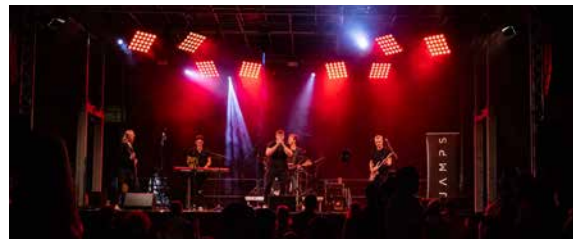
SCHULHOF 19:30 – 24:00 UHR JAMPS