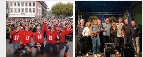
RATHAUS 19:00 – 19:30 UHR DIE HUMBAS 19:30 – 22:00 UHR LEVEL FREE

18:00 Uhr Öffnung der Weinstände und Höfe 18:30 Uhr Bühnenprogramm am Schulhof 19:00 Uhr Bühnenprogramm am Rathaus