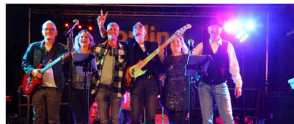
RATHAUS 19:30 – 24:00 UHR CANDIES